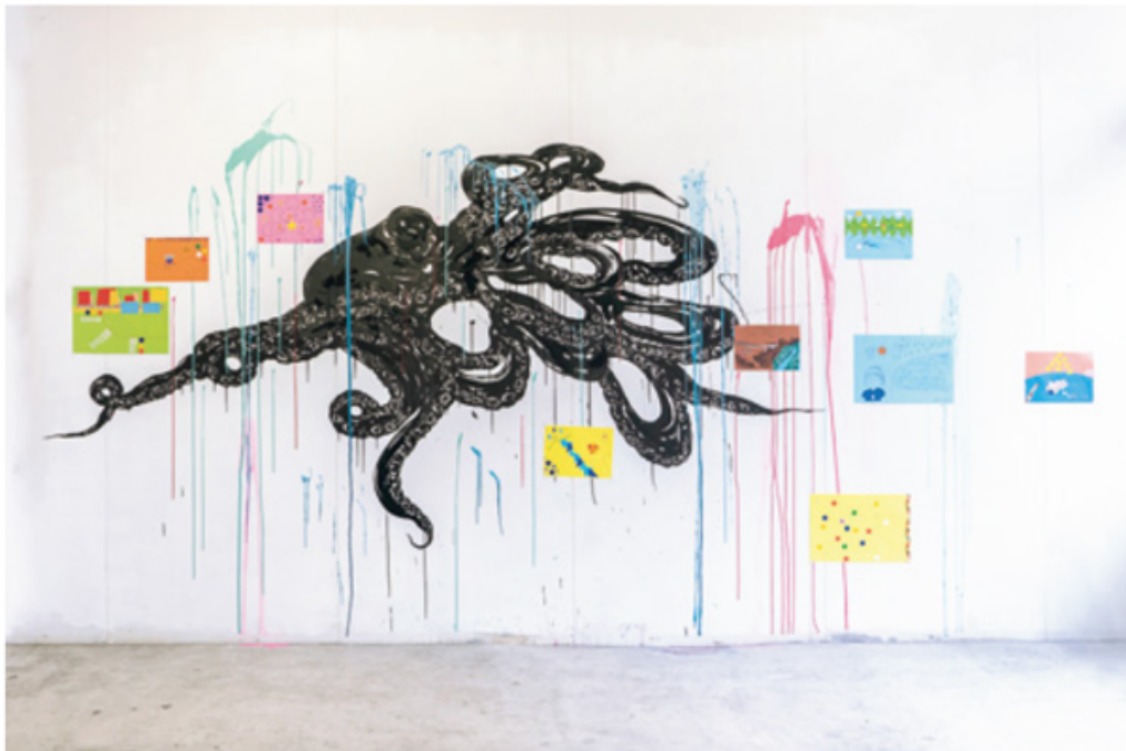
《A Night Trip》2020 A Night Trip, 2020

CIK: International Creator Residency Program