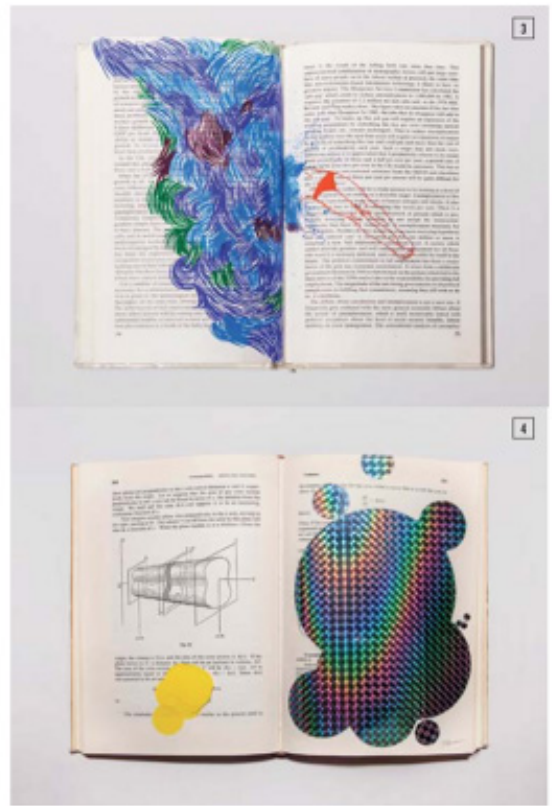
1. (작의 기호를) 2018 종이에 과수, 잉크 185x135cm 설치 전경 사진: 조준용 © Jhee Kim All rights reserved 2. (인간의 얼굴) 전시 전경 2019 컬러의 스스 사진: 조준용 © Jhee Kim All rights reserved 3. (5%) 2015 기부 받은 책 페이지에 과수 27.3x21.8cm 사진: 조준용 © Jhee Kim All rights reserved 4. (x=b) 2018 기부받은 책 페이지 위에 홀로그래프, 스티카 30x23cm 사진: 조준용 © Jhee Kim All rights reserved

위치, 규칙을 존중하지 않으며 정체성과 체계, 그리고 질서를 교란한다.* 육체가 배설물을 내보냄으로써 자신을 위협으로부터 보호하는 것처럼, 물감 또한 화면 어디서든 그저 터져버림으로써 상태를 숨기지 않는다. 있는 그대로 공간을 장악하는 이들은 온전한 하나의 신체 규범에 대한 저항의 목소리다. 지희킴은 이를 '액체적 사고'라 명명하길 제안한다. 이는 처음 얼룩 말을 그럴 때부터 작가가 작업에 포함시켰던 요소로, 당시에는 화려한 색상과 추상적인 마블링으로 비정형성을 담아냈다. 그러나 지금은 좀 더 즉흥적이고 발산하는 형태로 발전했다. 이전에는 정해진 구획을 마블링이 채웠다면, 지금은 어떻게 흘러갈지 모르는 우연함이 가장 자연스럽다는 듯 질서를 어지럽힌다.