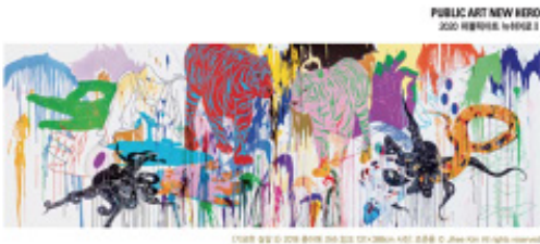
PUBLIC ART HERO 2020 유희킴, 167x167cm, 캔버스

Yoonji Cho, Jihee Kim PUBLIC ART, n° 167, p 82 - 85 Août 2020