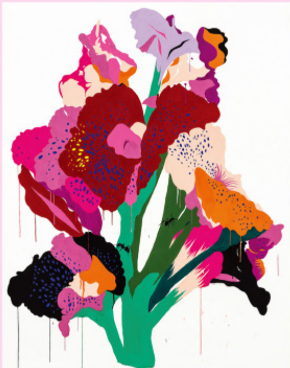
<중오심으로 불타는> 2022 아크릴 종이에 구아슈 140x113cm