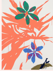
〈깊은 잠에 빠지는 Sleeping Like a Baby〉

디스위켄드룸에서 10월 19일부터 11월 13일까지 열린 개인전 《Sundays》 전시 전경