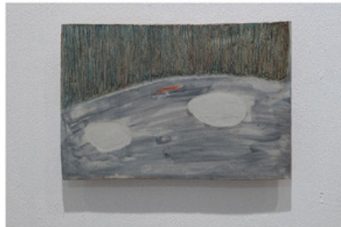
▲ SONG Myung-jin 宋明眞, Void, Pigment on Porcelain, 16.6x24.6cm, 2020

송명진 작가는 세라믹, 청자 위에 안료, 유약을 바르거나 스크린프린트 위에 풀라쥬, 드로잉 작업을 하는 등 다양한 매체로 시도를 한다. 드로잉으로 순간의 장면을 기록하고 도예와 판화 등의 다른 매체로 이미지와 형태를 재구성한다. 작가는 화면 안에 이미지를 기호화하여 점으로 표현한다. 점은 찍는 속도, 찍을 때 주는 힘 등에 따라 그 형태와 성질이 달라진다. 점들은 모두 가다듬은 호흡으로 하나 하나 찍어가는 반복적 행위는 순간을 기록하는 과정이며 계속해서 이어지는 현재들이다. 가다듬은 호흡으로 찍어낸 점은 각각의 성격을 지니게 된다. 신체의 운동을 수렴한 점들은 점의 제각기 다른 크기와 강도로 표면 위에 모여 리듬감과 움직임 표현한다.