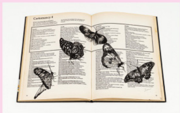
<Queen> 2022 린단에서 기증받은 책 페이지에 구아슈 28x43cm

그 사이에서 새로운 담화의 가능성을 모색하는 작가의 기본 맥락은 고스란히 유지된다. 인간이 가진 원초적 감각의 팔레트가 꽃과 곤충으로 서로 겹치며 완성되는 장면을 지금 만나보자.