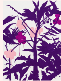
〈눈물을 참는 Fighting Back Tears〉

지희김 Jihee Kim, 〈깊은 잠에 빠지는 Sleeping Like a Baby〉, 2022, gouache on Arches paper, 76 x 57 cm