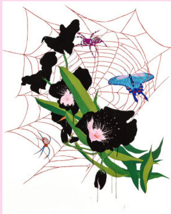
<복수를 꿈꾸는> 2022 아크릴 종이에 구아슈 150x131cm

그는 정원에 존재하는 요소의 성질을 각 개인의 내면을 대변하는 함축적 매개물로 상징한다. 고독하고, 때로 비참하고, 두근대거나 환희에 차 설레는 감정의 편린을 과감한 형과 색으로 완성한 것이다. 타인에게 남겨받은 책에 드로잉을 얹으며 서재와 긴밀하게 연결했던 작가는 정원과 서재가 많이 닮았음을 깨달았다. 두 공간은 인공적으로 구축된 곳이며 동시에 사람들이 늘 가꾸고 관리하며 삶의 한 부분으로 수용한다는 점에서 비슷하다. 이것이 전시 <선데이즈(Sundays)>를 위한 개념적, 상징적 배경이 되었다. 서사는 변주됐지만 인간을 둘러싼 사회의 관습적 개념의 범위를 해체하고