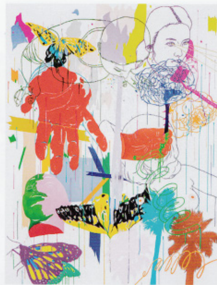
(작가의 기호물 6) 2018 종이매 185x135cm