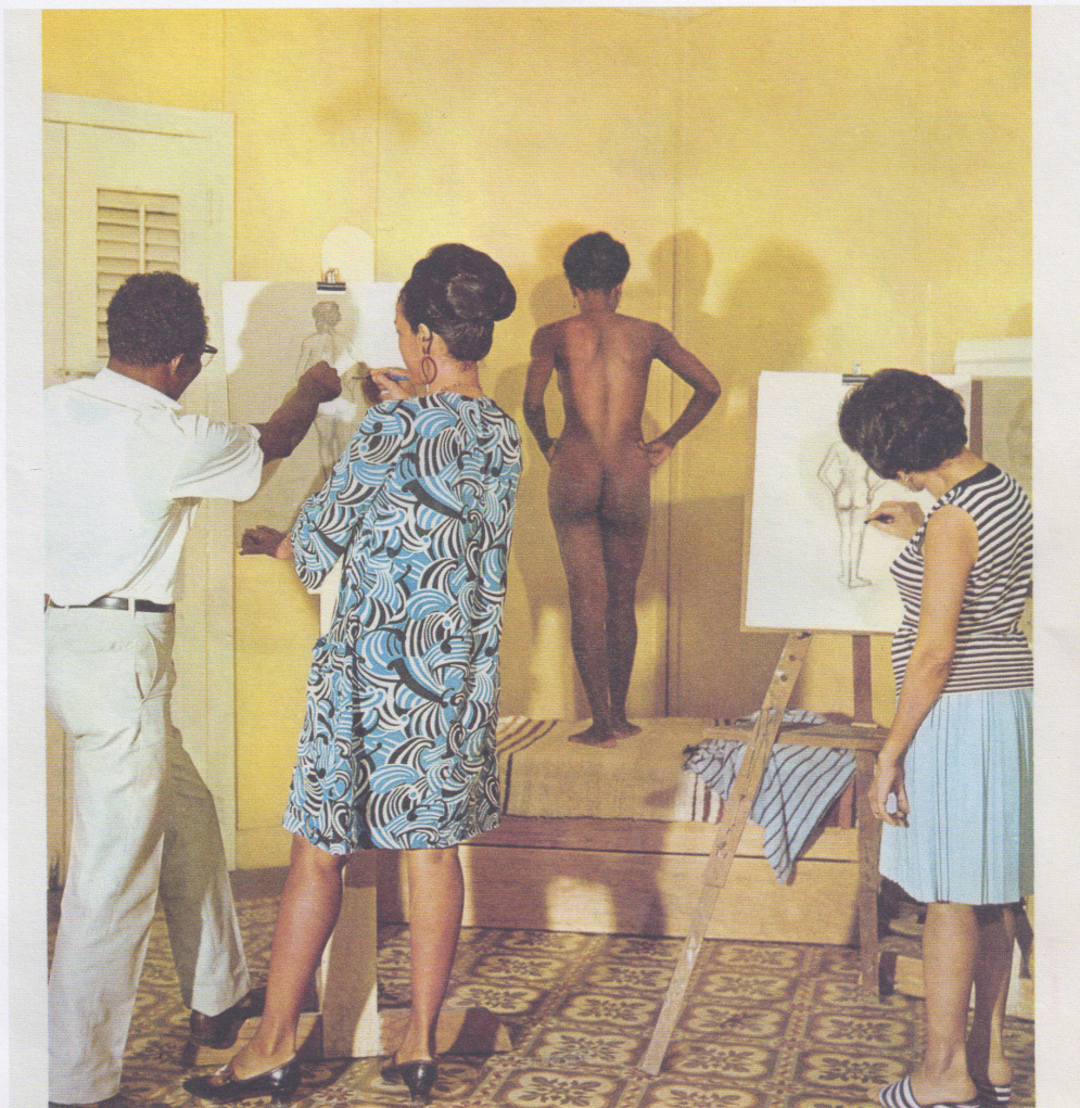
A « L'atelier », une classe de dessin.