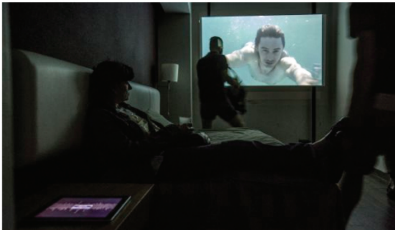
Instalación de Émile Brout & Maxime Marion (22.48 m2 Gallery), en la habitación 17 del hotel Catalonia Ramblas.

Archivado en: Loop Barcelona Ferias arte Espacios artísticos Cataluña Ferias comerciales España Eventos Arte Sociedad Comercio